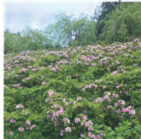
法面 3,000㎡に咲き誇る 平戸つつじ 見頃は4月上旬～