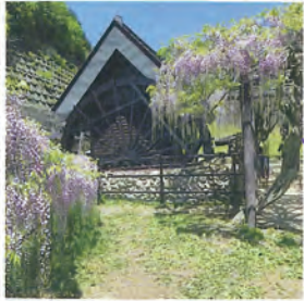
地区民で作上げた 直径5mの水車と水車小屋