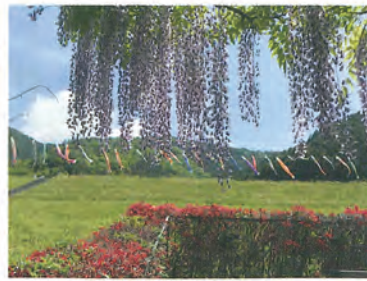
5月にはこいのぼりが泳ぐ 大町池（総貯水量 143,000m 3 / 平成6年7月完成）に映る姿は雄大